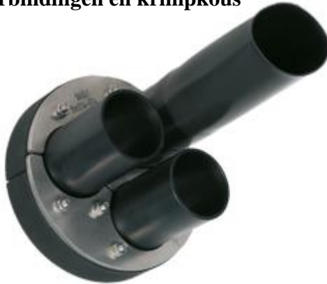
HDA 150/G/1/3x60 IKS