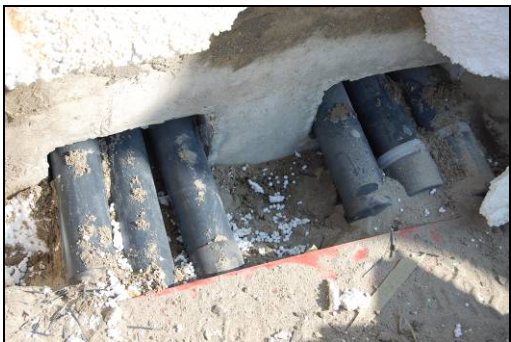
Situatie voor plaatsing voorbouwflens