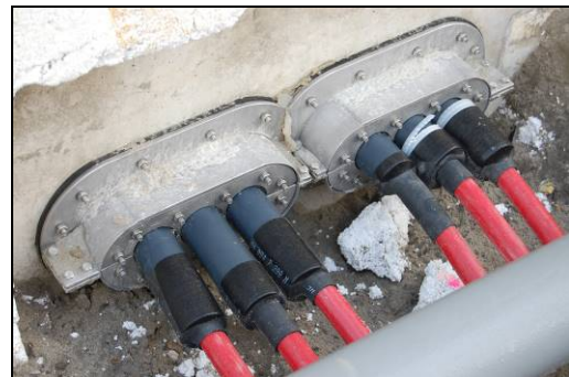
Situatie na plaatsing voorbouwflens