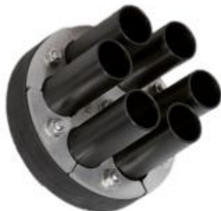
HDA 150/G/1/6x40 IKS