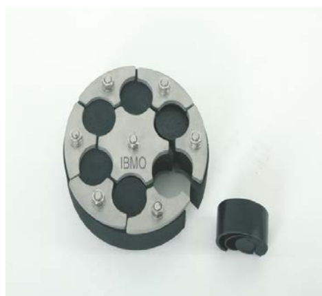
HDA 150/G/1/6x40WS IKS