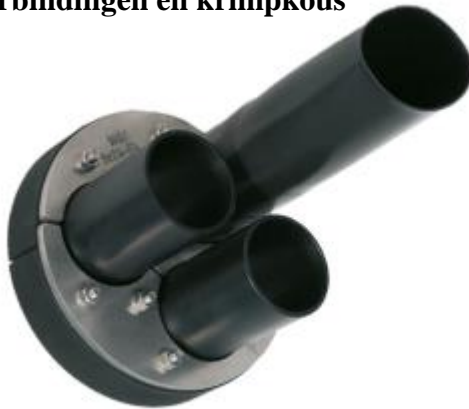
HDA 150/G/1/3x60 IKS