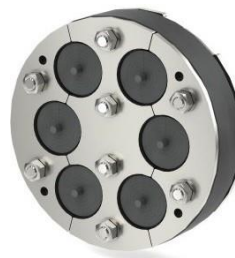
HDA150/G/1/6x40WS met 6 ui-ringen