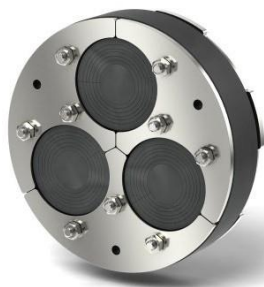
HDA150/G/1/3x60WS BKD met 3 ui-ringen