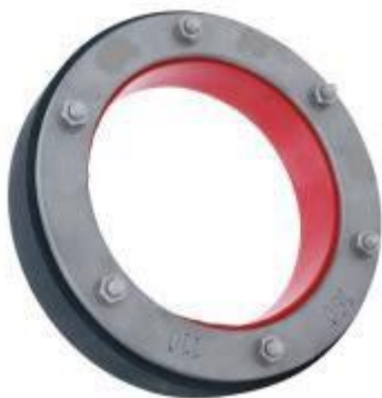
Voor geribbelde buis