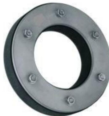
Voor Kabel- en Pijpdoorvoeren