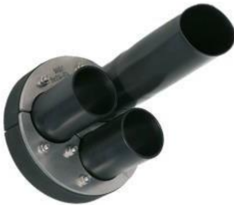
HDA 150/G/1/3x60 BKD