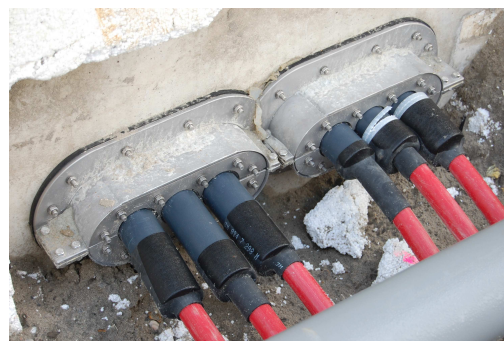
Situatie na plaatsing voorbouwflens