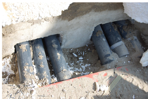
Situatie voor plaatsing voorbouwflens